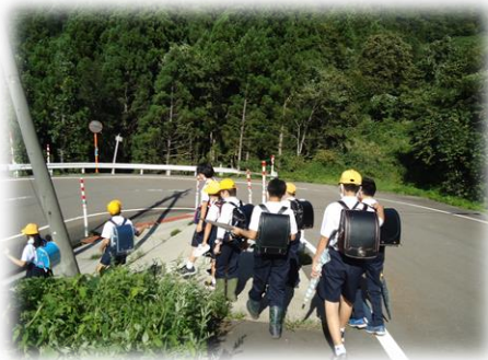
【風に気を付けて付き添い下校】