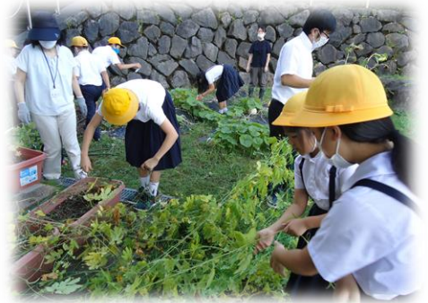
【つるがたくさん巻き付いている！】

一つ一つのことに立ち止まり、みんなが納得のいく方法を相談し、解決していこうとする子供たちの姿を嬉しく思いました。また、子供たちで解決することを信じて辛抱強く待つことの大切さも教えられた思いがしました。