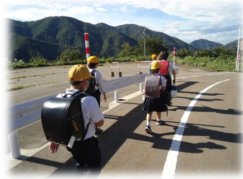
【雲の流れの速いことに驚いていました】