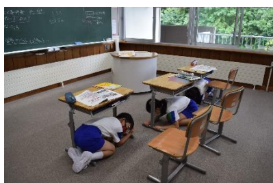
8月30日 シェイクアウト訓練

子供たちが夏休み中に取り組んだ自由研究や工作等の作品が展示されました。友達の力作にみんな興味津々でした。