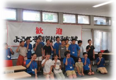
【武蔵野市役所での歓迎式】