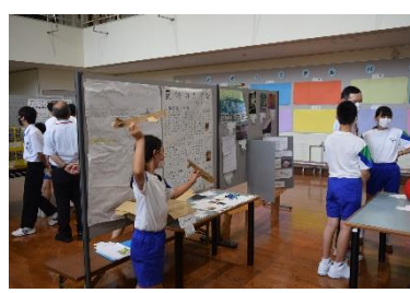
8月24日～ 夏休み作品展

これまでの練習の成果を確かめるために記録会を行いました。一人一人が自分の記録に挑戦し、よい結果を残しました。