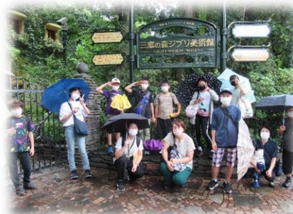
【三鷹の森ジブリ美術館】