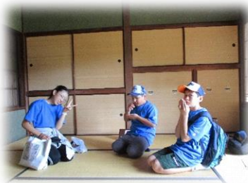
【江戸東京たてもの園】