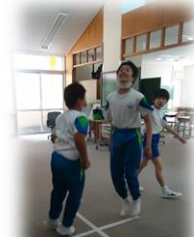
【「あんたがたどこさ」に合わせて】