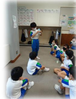
【ぼくのたたみ方は・・・】

友達の提案を聞き入れる、自分はどうかと振り返る、解決に向けて考えるなど、自分たちの暮らしを自分たちで整えていこうとする子供たちの姿をうれしく思いながら、話し合いの様子を見ていました。