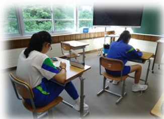
【読み出したら止まらない!】