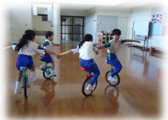
【みんなで手をつないで】

高学年は、集中して読書したり、体を動かしてみんなで楽しんだりと始業前のひとときを大切に過ごしています。