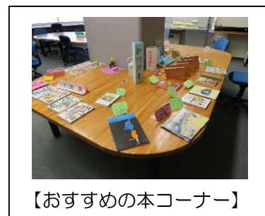
【おすすめの本コーナー】