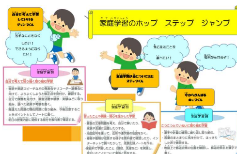
【家庭学習のホップステップジャンプ】

また、学習の定着率は、聞くことは5%、見ることは20%と言われていています。しかし、人に教えたことは90%程度記憶に残るそうです。私も子供の頃、習ったことをよく忘れて叱られたものです。忘れるのは当たり前と捉え、「人に教えられるように学ぶ」「人に教えたくなることを学ぶ」と、学び方を自ら計画し、学習の仕方を工夫させてあげることが、より効果的な学習方法なのだと思います。今後も、子供たちが自主的に、効果的に学びを進めていけるよう、指導・支援してまいりたいと思います。