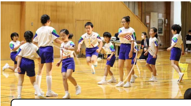
全校音楽「マリーゴールド」 体育「利賀リンピック」