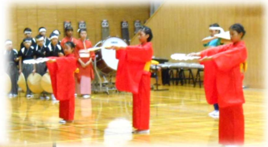
上学年 民謡 「むぎや節」