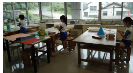
作品づくりでは、友達のアイデアに感心したり、自分の思い通りになるように試行錯誤したりしながら、じっくりと取り組んでいました。左：中学年、右：低学年