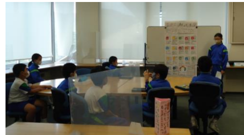
高学年は、これまでの学習の成果を他の学年に発表し、その反応を確かめていました。