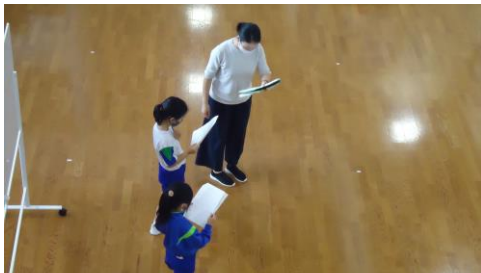
低学年は、担任の先生と一緒に動きながら自分の動きを確認していました。

日頃の学習の成果を発揮するためには、子供自身が目当てをもつことが大切だと思います。各担当者は、「どうなりたいのか。」「そのために、どうしようと思うのか。」など学級や学年全体だけでなく、一人一人の思いを聞き出し、寄り添って指導している姿が見られます。